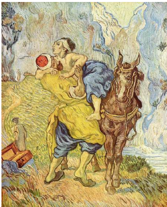
Vincent Van Gogh "Il buon Samaritano" 1890

interpella, col suo dolore e le sue richieste, con la sua gioia contagiosa in un costante corpo a corpo. L'autentica fede nel Figlio di Dio fatto carne è inseparabile dal dono di sé, dall'appartenenza alla comunità, dal servizio, dalla riconciliazione con la carne degli altri. Il Figlio di Dio, nella sua incarnazione, ci ha invitato alla rivoluzione della tenerezza.»