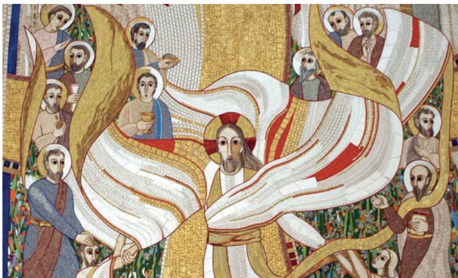
[p. M. Rupnik, la Resurrezione di Cristo]

Quanta sofferenza leggiamo nei volti delle persone che incontriamo; quanto forte è per noi il virus dell'egoismo, della preghiera che lascia il posto allo sparlare gli uni degli altri credendoci esperti in tutto, tranne che nella misericordia. Invece Gesù,